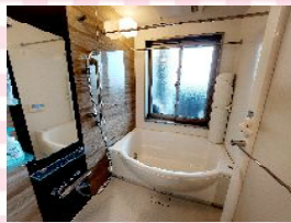
■浴室乾燥機付お風呂