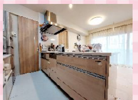
■食洗機付キッチン